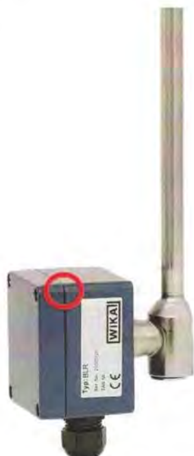
Рисунок 6 – Место нанесения на корпуса датчиков BLR пломбы поверителя