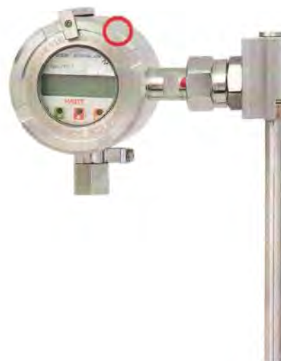
Рисунок 7 – Место нанесения на корпуса датчиков BLM пломбы поверителя