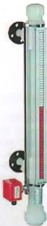
Рисунок 2 – Общий вид уровнемеров модели ВНА (исполнение с герконовым датчиком; пластиковый корпус)