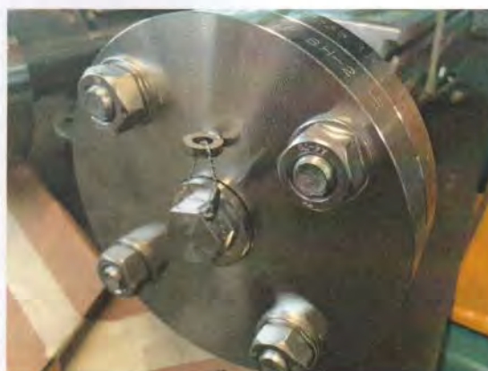
Рисунок 5 – Варианты пломбирования корпуса уровнемера BNA пломбой поверителя

Пломбирование корпуса датчиков может осуществляться нанесением на боковую поверхность корпуса датчика пломбы поверителя (в виде наклейки), которая разрушается при попытке удалить ее или вскрыть корпус (Рисунки 6 и 7).