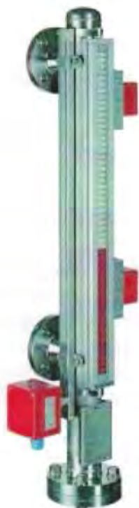
Рисунок 1 – Общий вид уровнемеров модели ВНА (исполнение с герконовым датчиком и двумя магнитными переключателями; стальной корпус)

В целях контроля за уровнем (контроль переполнения, сигнализация и т.д.) уровнемер может дополнительно комплектоваться герконовым переключателем ВГУ. Переключатель монтируется на определенной высоте на байпасной камере ВЗГ при помощи хомута или на индикатор ВМД при помощи специальных крепежей. Когда поплавков в байпасной камере достигает уровня, отмеченного на корпусе переключателя, магнитное поле поплавка вызывает срабатывание переключателя.