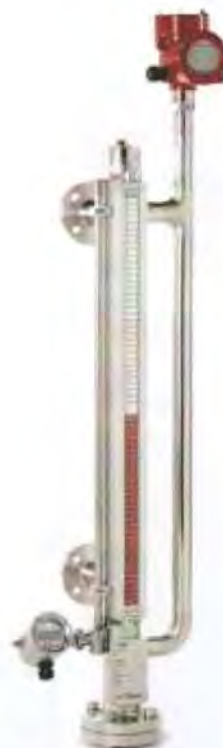
Рисунок 3 – Общий вид уровнемеров моделей ВНА-SD (DUPlus), ВНА-HD (DUPlus) (исполнение с магнитострикционным датчиком на первой байпасной камере и контактным микроволновым датчиком на второй байпасной камере)